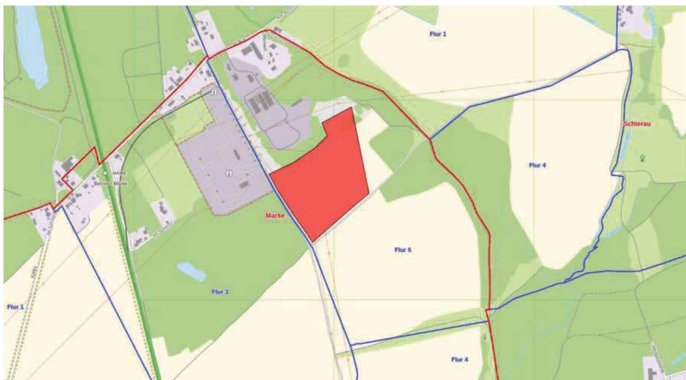
Abbildung 1: Lage des räumlichen Geltungsbereichs | Kartengrundlage: LVermGeo – Sachsen-Anhalt-Viewer 2026

Die Lage des Plangebiets kann dem nachfolgenden Übersichtsplan entnommen werden: