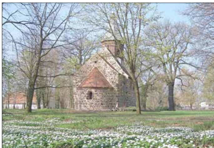
Frühling im Gutspark

Eigentlich sollte es endlich wieder losgehen. Wir waren gut gewappnet, um pünktlich am 01.04.2020 in die Saison 2020 zu starten. Sämtliche Vorbereitungen waren abgeschlossen; ein bewährtes Team im Kassenbereich und Mitarbeiter für die Bewirtschaftung/Unterhaltung unseres Parks wartete gespannt auf seinen Einsatz. Doch leider zwingt uns das Corona-Virus und die damit einhergehenden Vorsorgemaßnahmen, die Pforten vorübergehend noch geschlossen zu halten. Sobald sich die aktuelle Lage verbessert und wir unseren Gutspark ohne Bedenken wieder öffnen können, informieren wir Sie, liebe Besucher