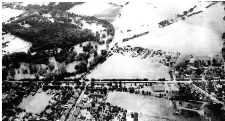
Land unter im Bereich Raguhn